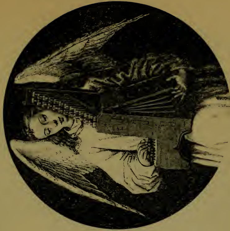
Anges célébrant l'Apothéose de Ste-Ursule, faite de la Chasse de Ste-Ursule.